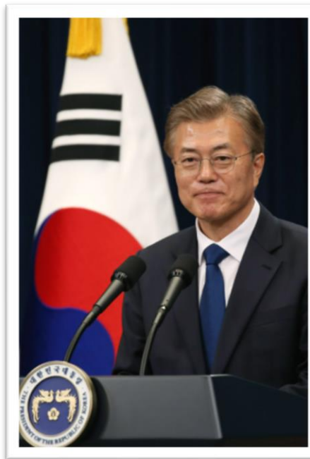
ประธานาธิบดีมุนแจอิน