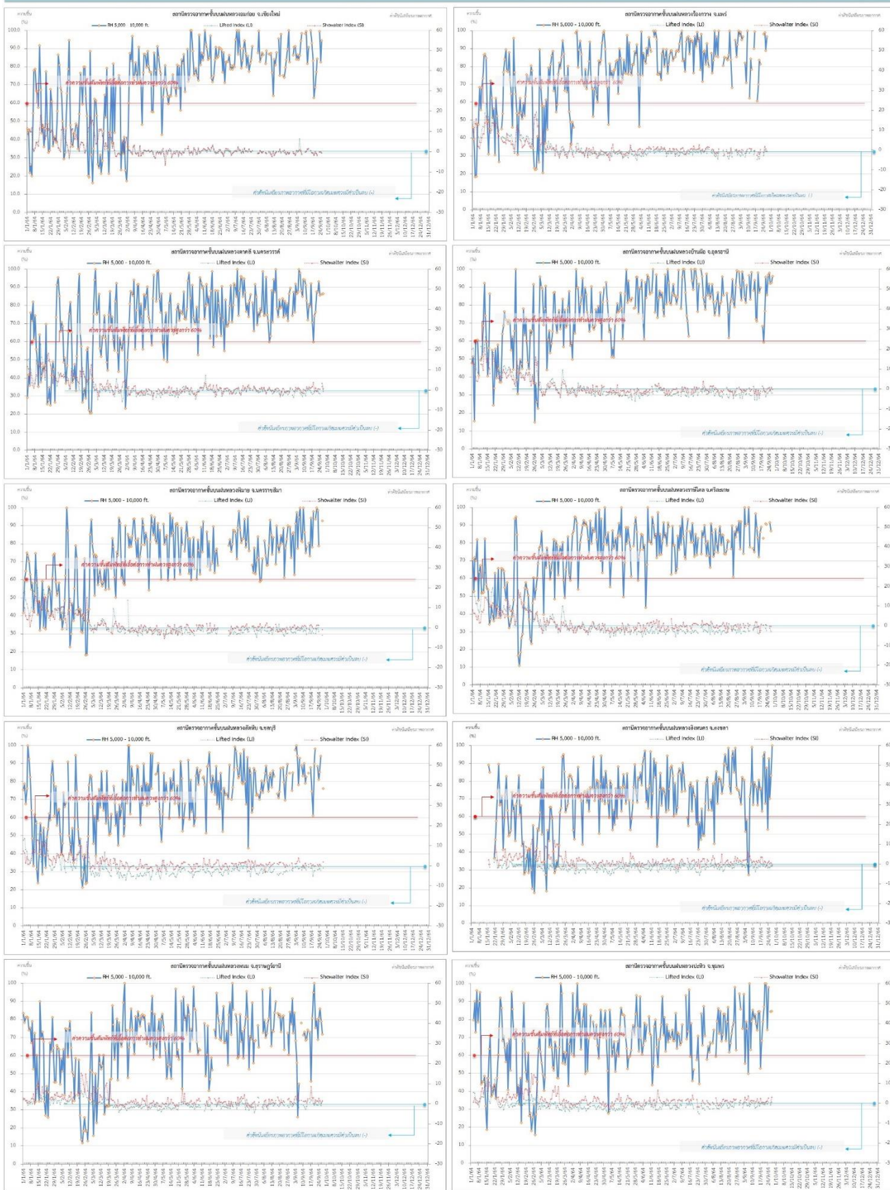
กราฟแสดงผลตรวจอากาศชั้นบน (ระยะ 5,000 - 10,000 ฟุต) ตั้งแต่วันที่ 1 มกราคม 2564 - ปัจจุบัน